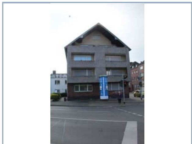
Blick Marienburger Str.